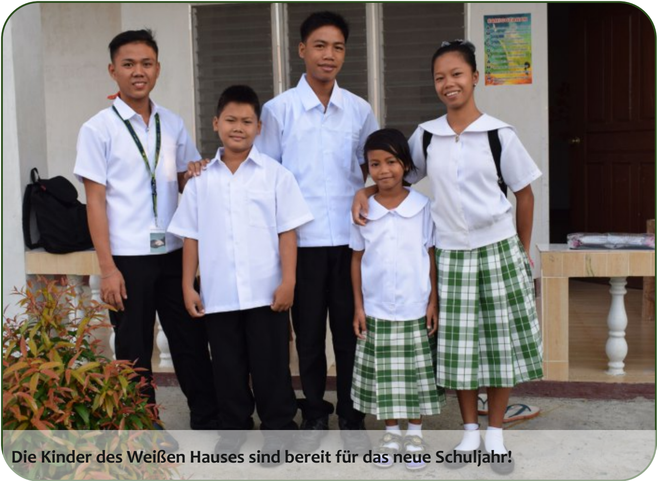
Die Kinder des Weißen Hauses sind bereit für das neue Schuljahr!

Kreative Freizeitaktivitäten, lange Filmnächte und sogar ein Ausflug in das nahe gelegene Schwimmbad - die unbeschwertere Ferienzeit hatte auch für die Kids im Kinderdorf nun leider ein Ende: am 13. Juni hieß es wieder: „Fleißig hinter die Schulbank geklemmt und ran an die Bücher!“